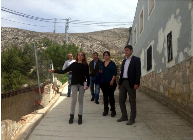
Ávila se compromete a poner en marcha un Plan que mejore y ordene el barrio de Tiradores

latribunadecuenca.es - sábado, 25 de abril de 2015