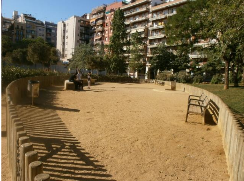
Imagen adjunta a la propuesta de Alba Andrés en decide.cuenca.es. Ejemplo zona canina en un parque en Barcelona.