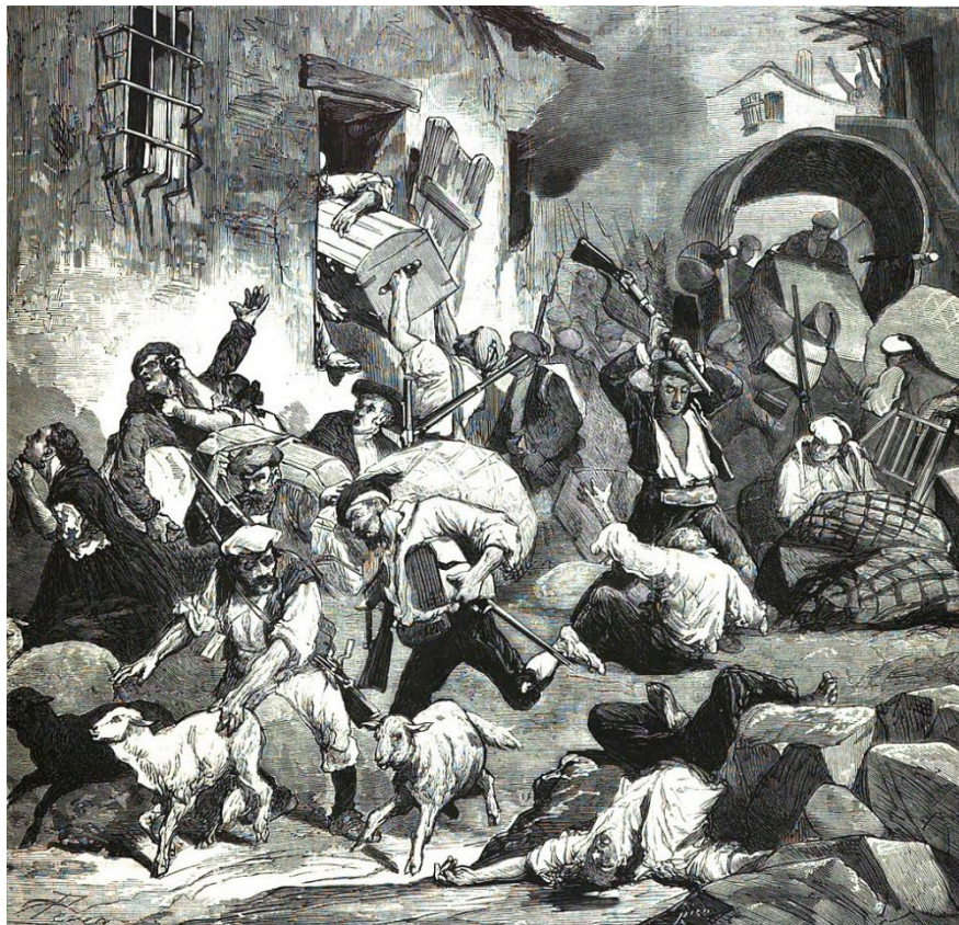
1. «Sucesos de Cuenca.—El saqueo» (La Ilustración Española y Americana, 30 de julio de 1874)