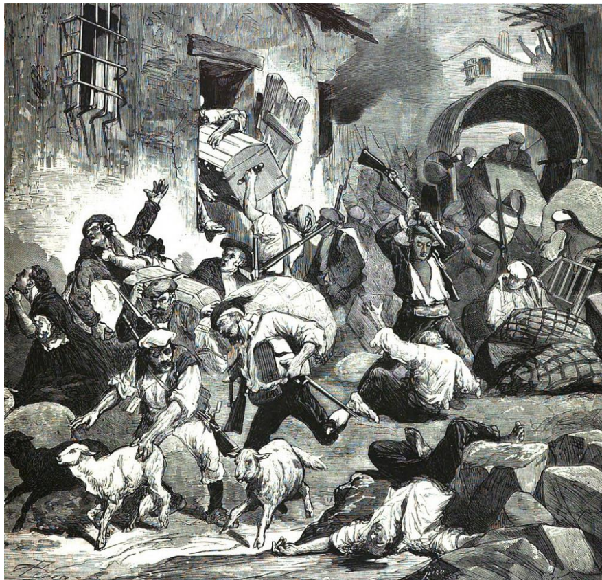
1. «Sucesos de Cuenca.—El saqueo» (La Ilustración Española y Americana, 30 de julio de 1874)